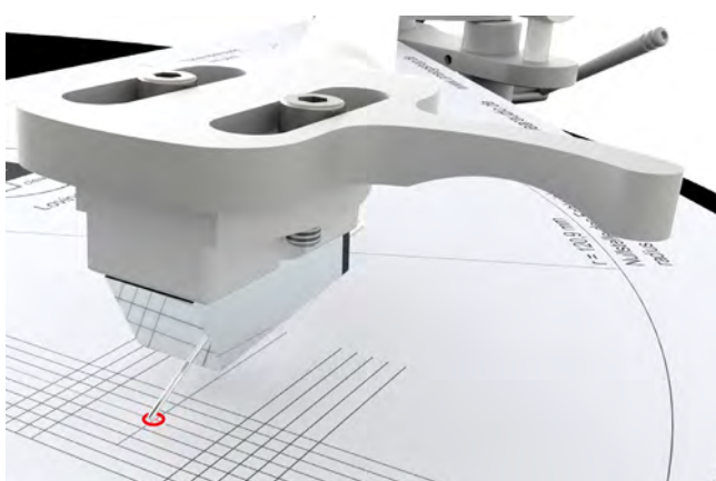
Abb. 1: Referenzpunkt

Richten Sie Tonabnehmer niemals aus solange dieser abgesenkt ist, zur Justage immer den Lift betätigen und anschließend zur Kontrolle erneut absenken.