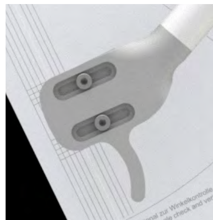
Abb. 2: Ausrichtung des Tonabnehmers