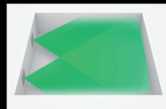
DALI-Konstruktionsprinzip mit einem besonders breiten Abstrahlwinkel