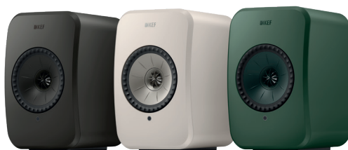
Graphite Grey (Grau)