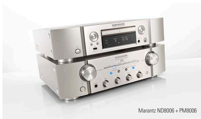
Marantz ND8006 + PM8006

D&M Germany GmbH A Division of Sound United An der Kleinbahn 18 41334 Nettetal Deutschland