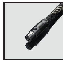
Mini XLR (f)