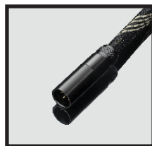
Mini XLR (m)