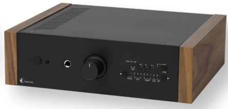
Schwarz mit Walnuss Holzseitenteilen