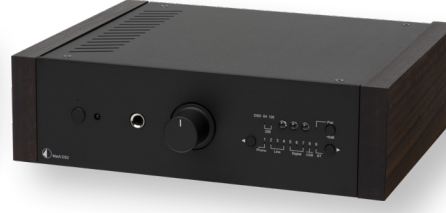
Schwarz mit Eukalyptus Holzseitenteilen