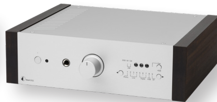
Silber mit Eukalyptus Holzseitenteilen