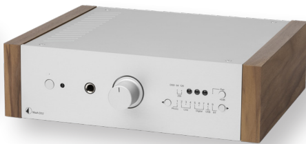
Silber mit Walnuss Holzseitenteilen