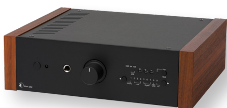
Schwarz mit Rosenholz Seitenteilen