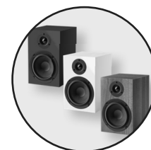
Erhältlich in Schwarz, Weiß, Rot & Walnuss