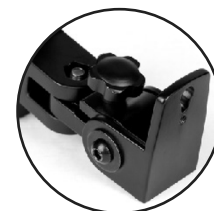
Wandhalterung separat erhältlich