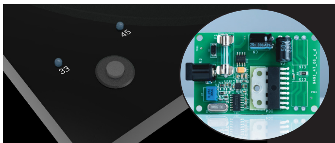
Elektronische Geschwindigkeitsumschaltung zw. 33/45 RPM DC/AC Motorsteuerung für genauen und präzisen Antrieb

Wobei viele andere Plattenspieler unregelmäßige Gleichstrommotoren mit massiven Gleichlaufschwankungen eingebaut haben, verfügt der T1 Phono SB über unseren etablierten, elektronisch geregelten, präzisen Wechselstrommotor. Der T1 Phono SB hat darüber hinaus eine elektronische Geschwindigkeitsumschaltung zwischen 33 und 45 RPM. Dieses System garantiert einen geräuscharmen, stabilen Antrieb des Plattenspielers.