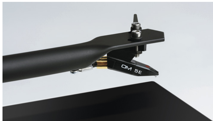
Hochqualitativer Ortofon OM 5E MM Tonabnehmer mit elliptischem Stylus

Der Plattenteller des T1 wird per Riemen angetrieben. Dieser überträgt präzise die Antriebskraft auf den neu designten Subteller, welcher wiederum in dem ultra-präzisen 0,001mm Plattentellerlager mit einem gehärtetem Edelstahl in einer Messingbuchse sitzt; genau wie in unseren bewährten Essential III Modellen.