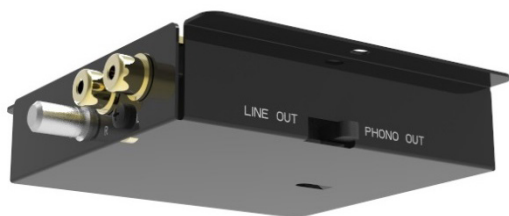
Integrierter Phono-Vorverstärker Umschaltbar zwischen Phono und Line Level Ausgang

Der T1 von Pro-Ject Audio Systems ist der erste Plattenspieler der T-Line, der für wenig Geld bereits echte HiFi Klangqualität liefert. Dieser glänzt mit hochwertigen Materialien, einem stylischen Aussehen und einem unglaublich lebendigen Sound. Während des umfangreichen Entwicklungsprozesses wurde akribisch darauf geachtet, dass trotz des unglaublichen Preises keine Kompromisse in Sachen Klangqualität gemacht werden. Im Vergleich zum Standard T1-Model, verfügt die Phono SB Version über einen integrierten, von Pro-Ject entwickelten, hochqualitativen MM Phono-Vorverstärker und eine elektronische Geschwindigkeitsumschaltung zwischen 33 und 45 RPM.