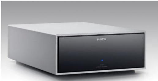
Revox Joy Netzwerk Receiver S119

Verwandeln Sie mit den Revox Joy Netzwerk Receivern Ihre Räume in hochmoderne Klangräume!