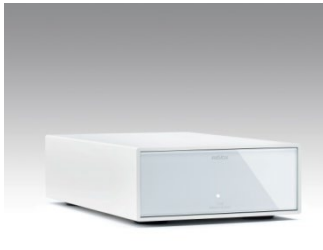
Revox Joy S119 / S120