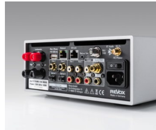
Revox Joy S119 / S120 Rückansicht