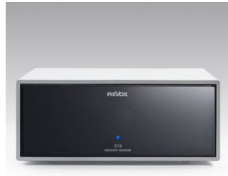
Revox Joy Frontalansicht