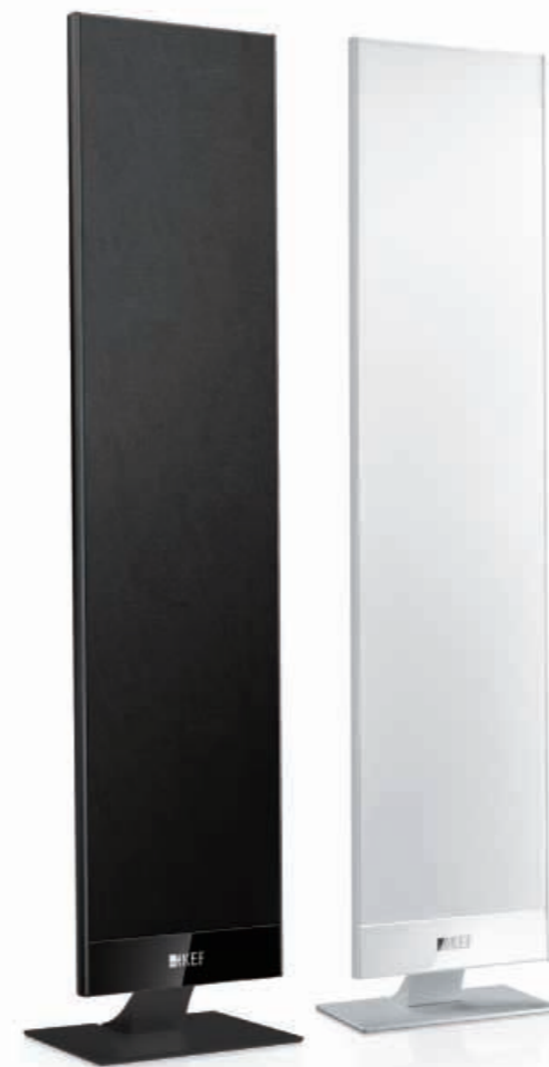
T301 und T301c Lautsprecher

Die Standardlautsprecher der T-Serie können sowohl vertikal als Satelliten (entweder an der Wand oder auf den mitgelieferten Tischstandfüßen bzw. den optionalen Bodenstandfüßen) als auch horizontal als Center-Lautsprecher verwendet werden, Sie enthalten KEFs neuen 115mm Tief-/Mitteltöner mit ultraflachem Profil, gepaart mit dem neuen belüfteten 25mm Hochleistungshochtöner.