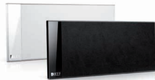
T101 und T101c Lautsprecher

Die Standardlautsprecher der T-Serie können sowohl vertikal als Satelliten (entweder an der Wand oder auf den mitgelieferten Tischstandfüßen bzw. den optionalen Bodenstandfüßen) als auch horizontal als Center-Lautsprecher verwendet werden, Sie enthalten KEFs neuen 115mm Tief-/Mitteltöner mit ultraflachem Profil, gepaart mit dem neuen belüfteten 25mm Hochleistungshochtöner.